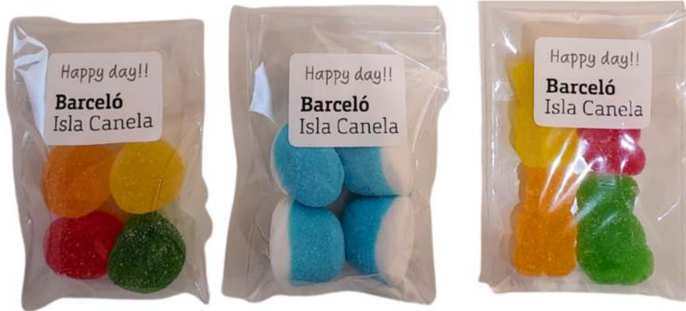
Bolsa 7x10 cm con 4 gominolas REF. BC3