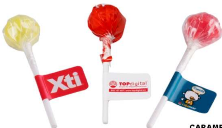
CARAMELO CON PALO REDONDO Y BANDEROLA Pedido mínimo: 12.500 unidades