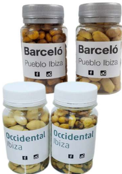
Bote de frutos secos 100ml REF. BCHF100