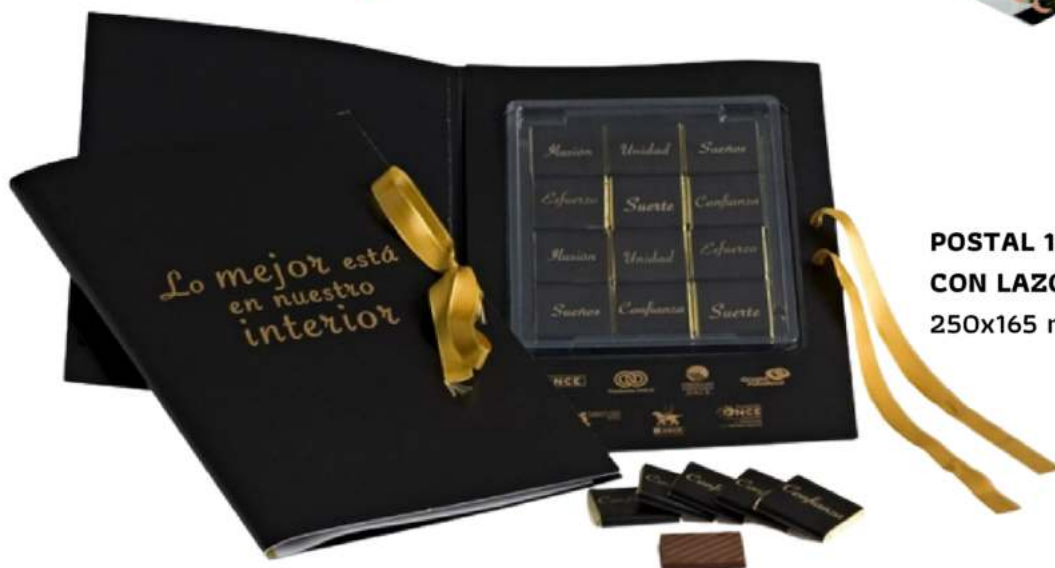
POSTAL 12 NAPOLITANAS CON LAZO 250x165 mm.