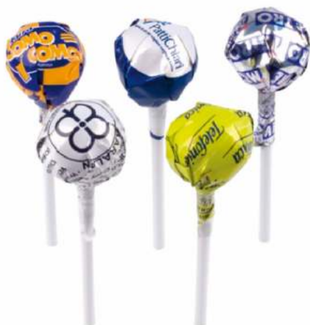
CARAMELO CON PALO REDONDO Pedido mínimo: 6.000 unidades