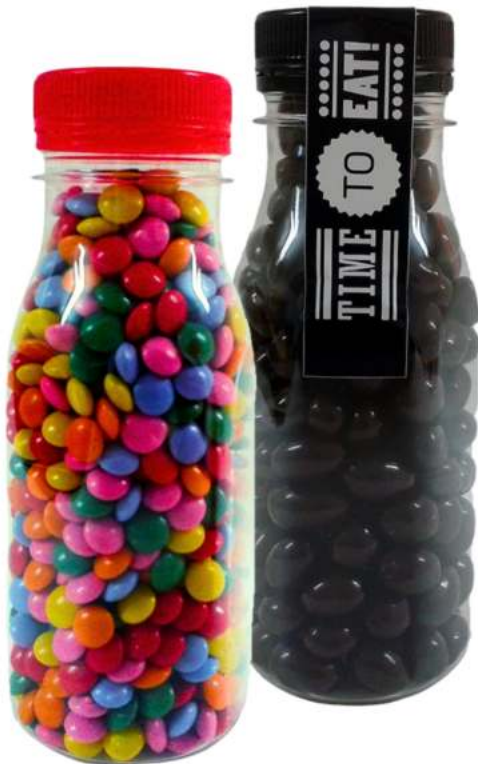
Botellas de chocolate 200ml REF. BTCH200