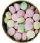
Comprimido menta sin azúcar