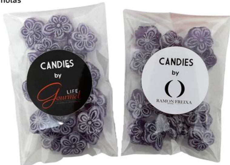
Bolsas de violetas 8x12 cm REF. BC4V