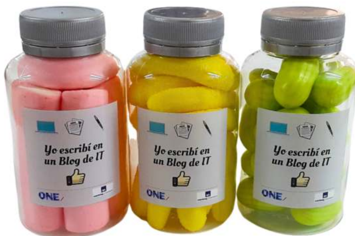
Bote 200ml gominolas REF. BC200