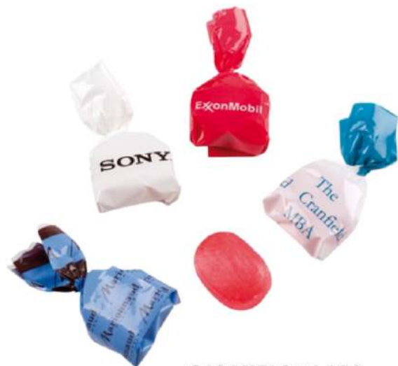
CARAMELO 1 LAZO 150 uds/kg