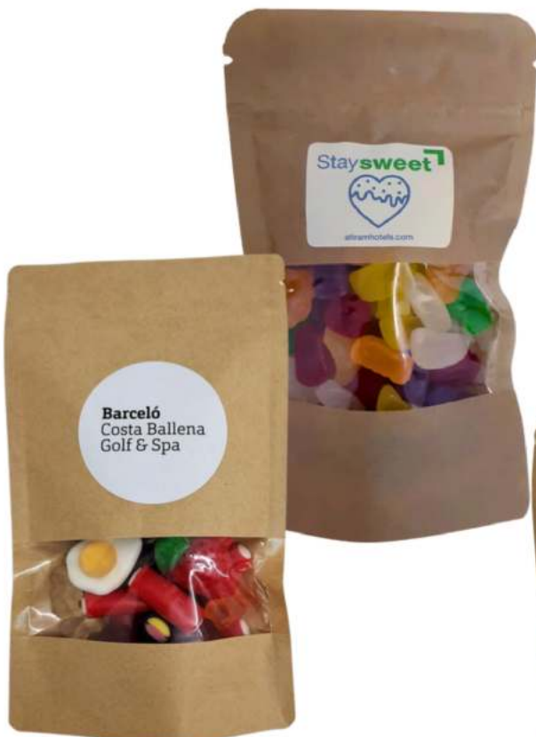
Bolsas kraft gominolas 12x20 cm - REF. BKC12