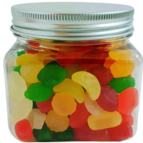
Tarro de gominolas 300ml REF. TCQ300