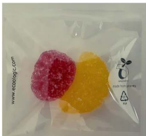
Bolsas Biodegradables y Compostables REF. BEC02

*Pedir presupuesto según medidas de bolsa y relleno