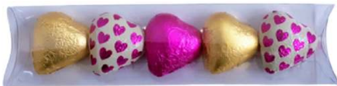
Estuche 5 corazones choco 15x5x5 cm REF. BCH315