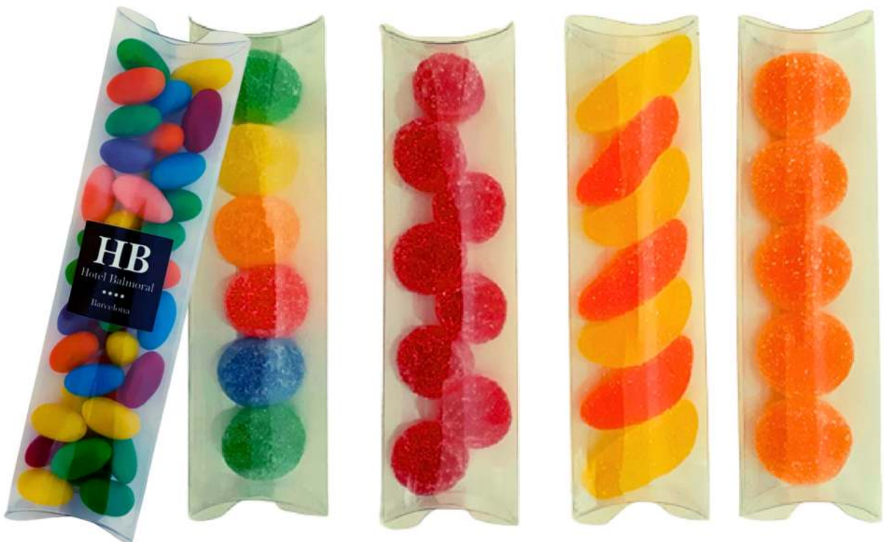
Estuche de gominolas 15x5x5 cm REF. BC315