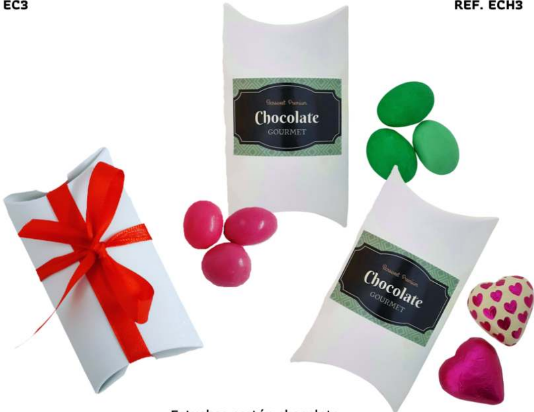
Estuches cartón chocolate REF. ECH3