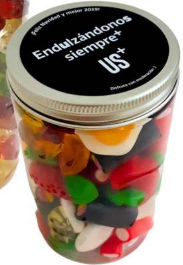
Tarros gominolas 400ml REF. TC400