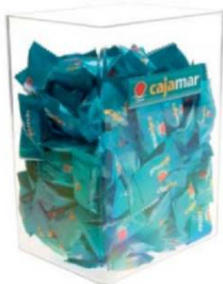
CAMELERA CUADRADA 130 x 100 x 180 mm. Plástico rígido