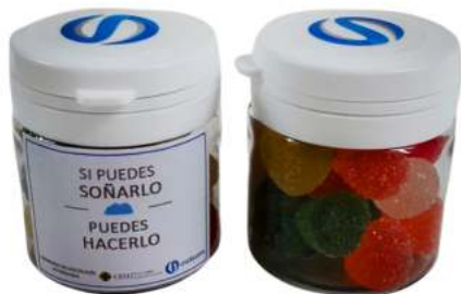
Bote 50ml gominolas REF. BC50