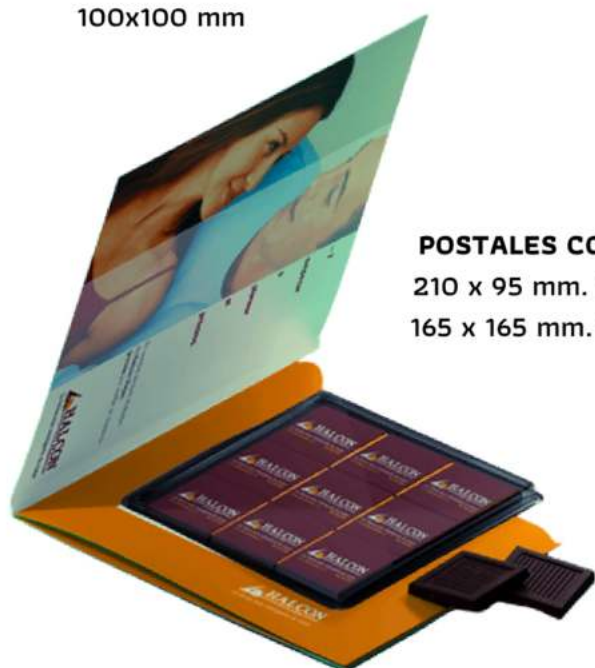
POSTALES CON NAPOLITANAS 210 x 95 mm. Con 4 napolitanas 165 x 165 mm. Con 9 napolitanas