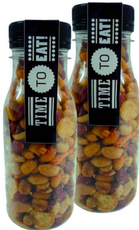
Botellas frutos secos 200ml REF. BTFS200