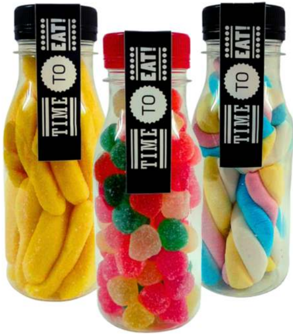
Botellas de gominolas 200ml REF. BTC200