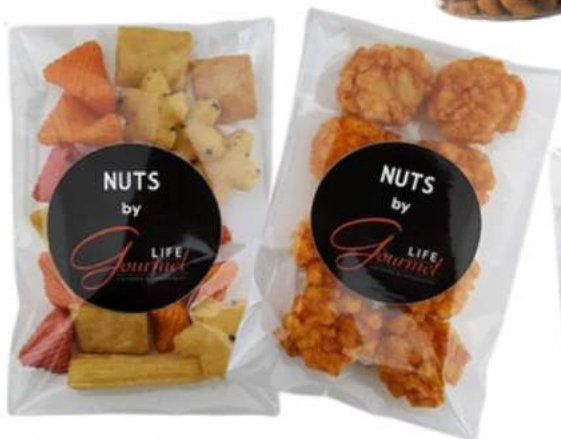
Bolsas de frutos secos 8x12 cm REF. BC4S1 || BC4S2