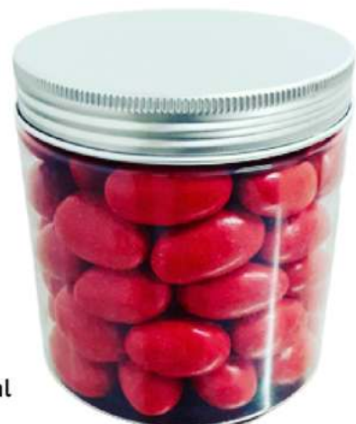
Tarro de chocolate 500ml REF. TCH500