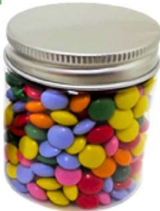
Tarro de chocolate 70ml REF. TCH70