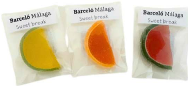
Bolsas de gominolas 6x8 cm REF. BC1