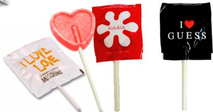
PIRULETA GRANDE Redonda o corazón 80 uds/bolsa