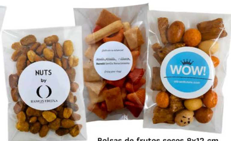
Bolsas de frutos secos 8x12 cm REF. BC4S3