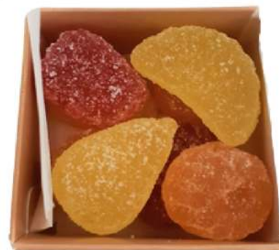
Caja gominolas 8x8x4cm REF. CK83