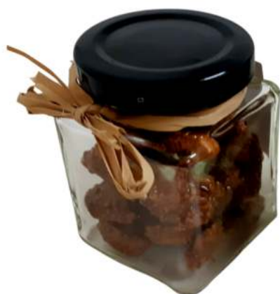
Tarro de frutos secos vidrio 106ml REF. TCVS106