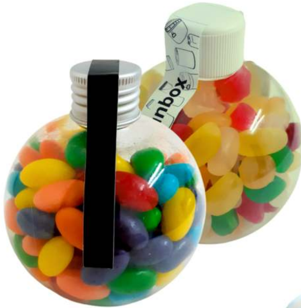
Tarro Bubble de gominolas 300ml REF. BBC300