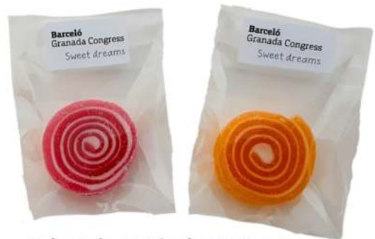
Bolsas de gominolas 6x8 cm REF. BC1