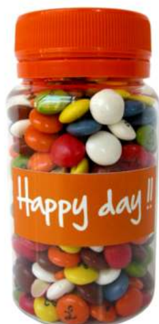
Bote de chocolate 100ml REF. BCH100