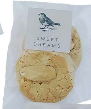
Bolsas de galletas 6x8cm REF. BG1*