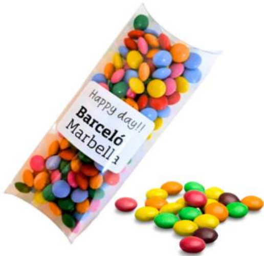
Estuche de grageas choco 10x5x5 cm REF. BCH3101