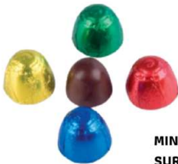
MINI BOMBÓN SURTIDO

Cacahuets con chocolate [10g] en una bolsa de papel kraft personalizable. Medidas: 70x70mm. Desde 5.000 uds.