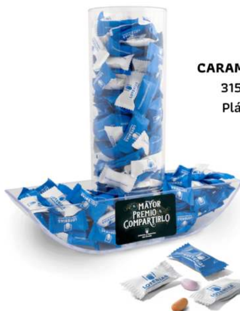
CAMELERA BARCO 315 x 295 mm. Plástico rígido