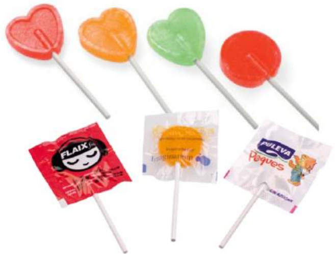
PIRULETA PEQUEÑA Redonda o corazón 200 uds/bolsa