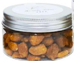
Tarro frutos secos 100ml REF. TCS100