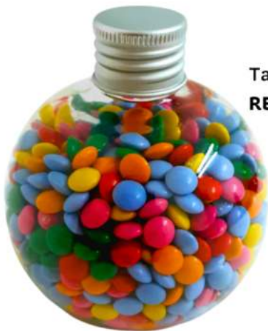
Tarro Bubble de choco 300ml REF. BBCH300