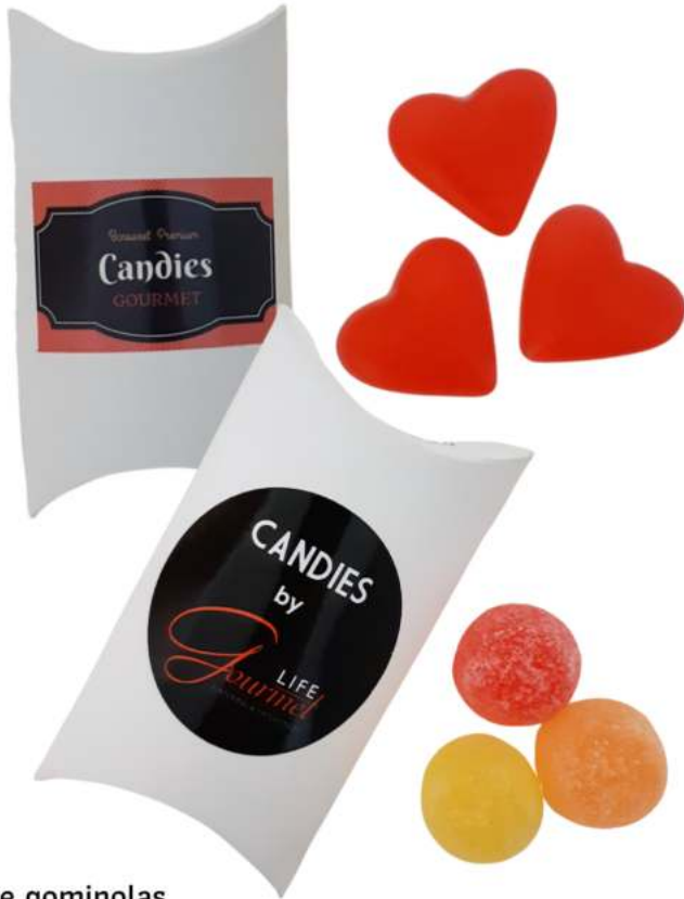
Estuche gominolas REF. EC3