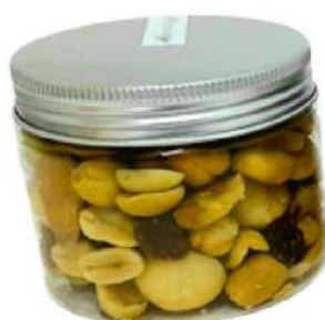
Tarro de frutos secos 150ml REF. TCS150