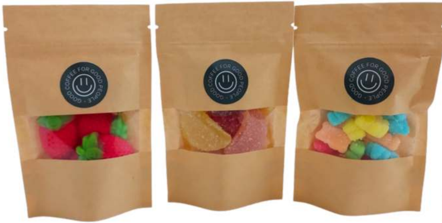
Bolsas kraft gominolas 9x14 cm - REF. BKC9