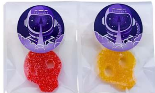
Bolsas de gominolas 6x8 cm REF. BC1