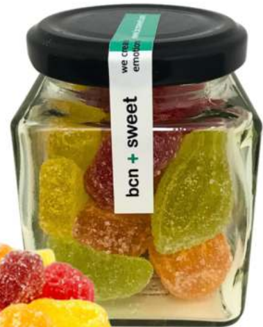
Tarros de gominolas 212ml REF. TCV212