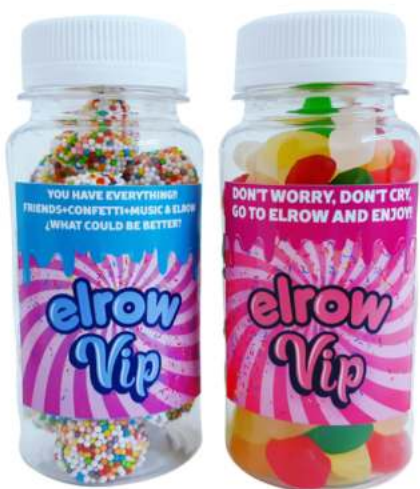
Bote 150ml gominolas REF. BC150