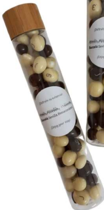
Tubo 90 ml bambú chocolate REF. TBS90B