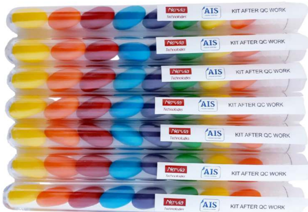
Tubo 16x150 mm caramelos REF. TBC19