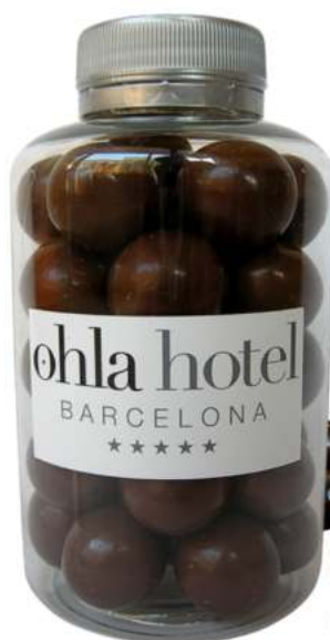
Bote de chocolate 300ml REF. BCH300