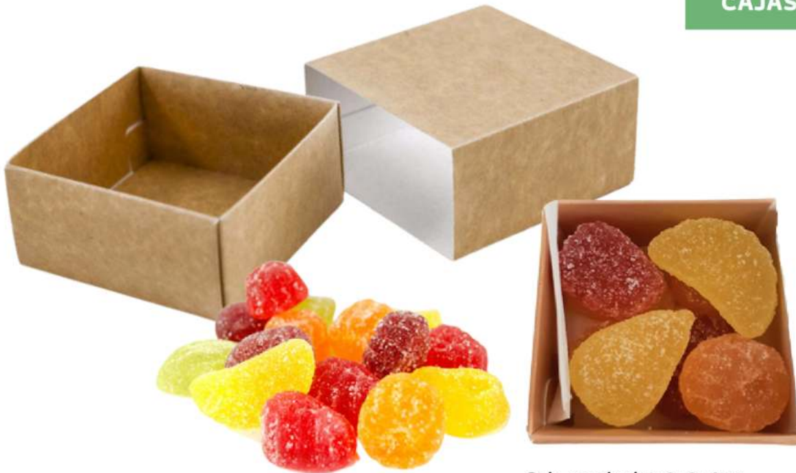
Caja gominolas 8x8x4cm REF. CK83