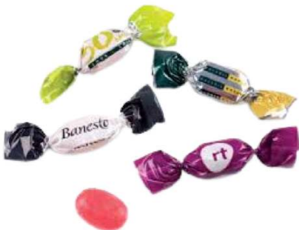
CARAMELO 2 LAZOS 300 uds/kg