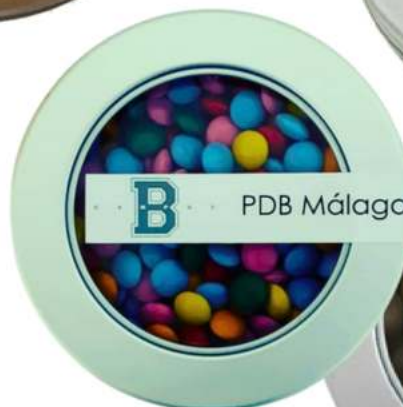
Lata 150 ml chocolate REF. TINH150