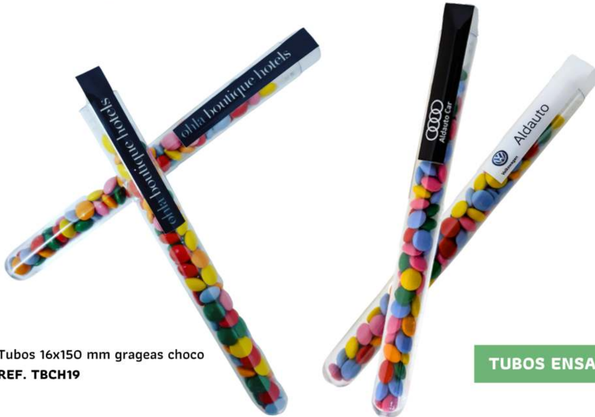
Tubos 16x150 mm grageas choco REF. TBCH19