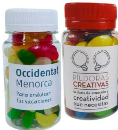
Bote 100ml gominolas REF. BC100