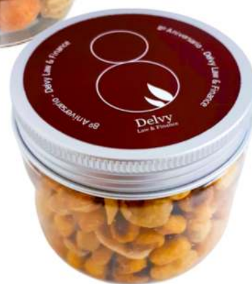
Tarro frutos secos 150ml REF. TCS150