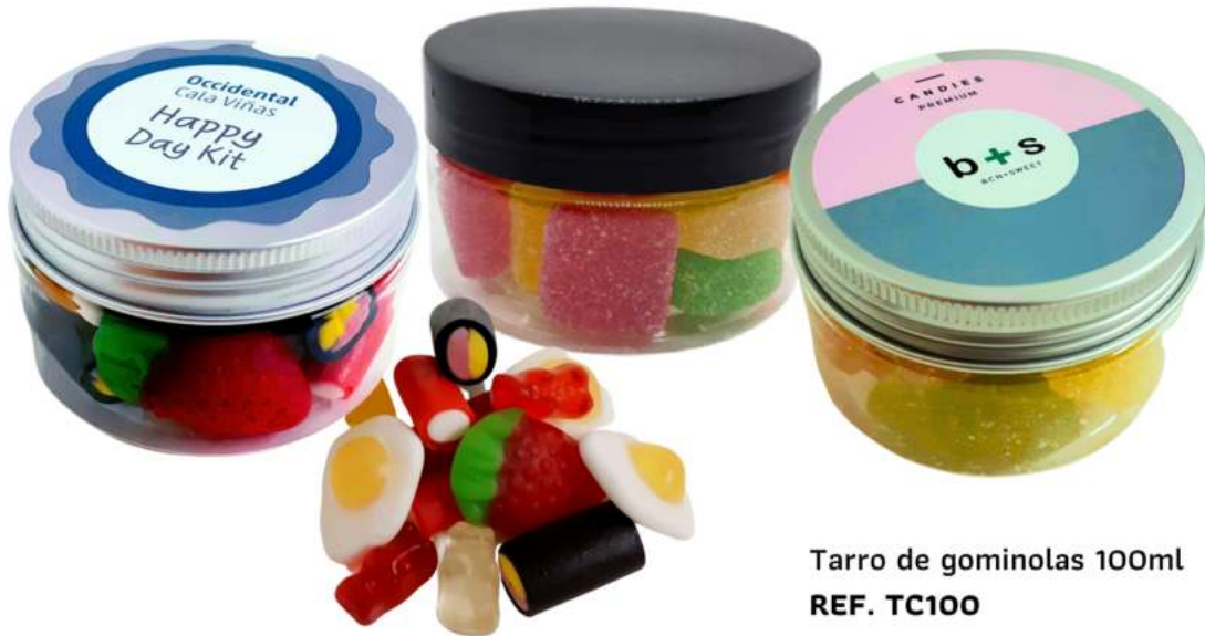
Tarro de gominolas 100ml REF. TC100