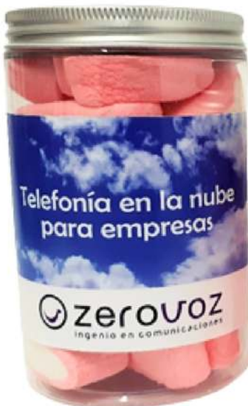
Tarro de gominolas 500ml REF. TC500