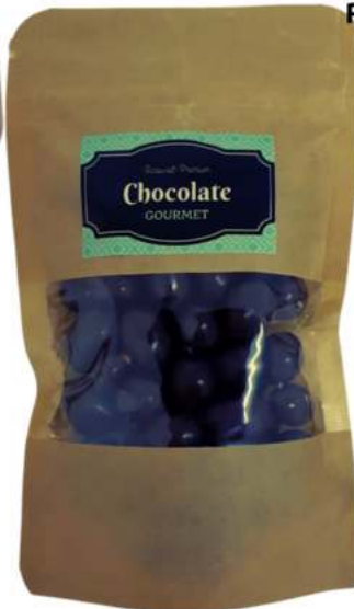
Bolsas kraft chocolate REF. BKCH9/ BKCH12