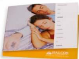
MINIPOSTALES 100x100 mm