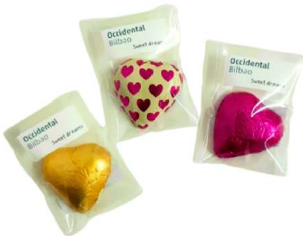
Bolsas de chocolate 4x6 cm REF. BCHO