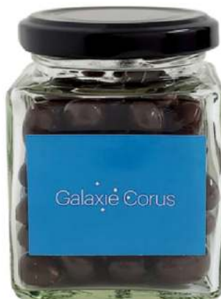
Tarro con chocolate 212ml REF. TCHV212