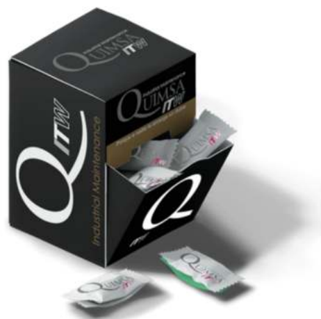
ESTUCHE MINIPESBRE 72 x 72 x 107 mm