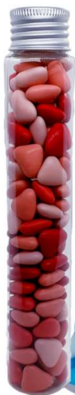
Tubo 90 ml aluminio chocolate REF. TBCH90A