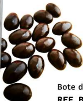
Bote de chocolate 500ml REF. BCH500