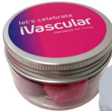
Tarro de gominolas 100ml REF. TC100