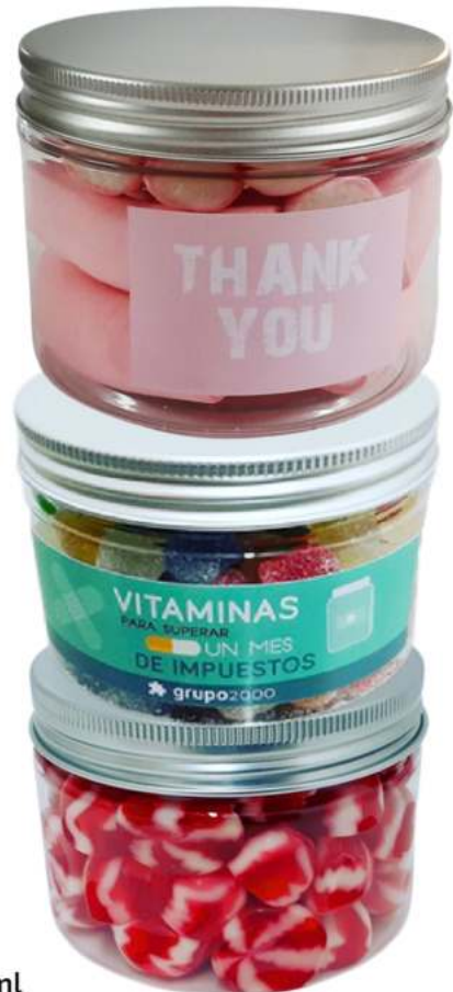
Tarro de gominolas 250ml REF. TC250