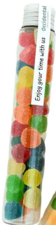
Tubo 90 ml aluminio gominolas REF. TBC90A