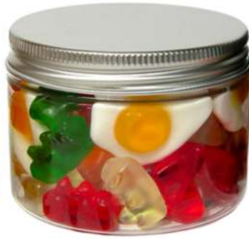
Tarro de gominolas 150ml REF. TC150