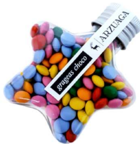
Estrella 80 ml grageas chocolate REF. STCH80