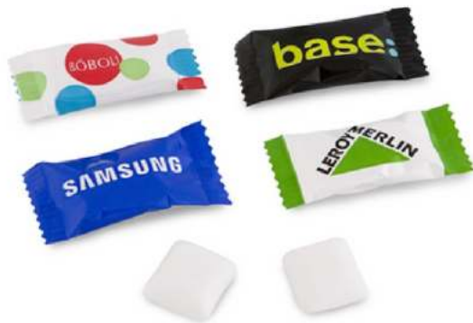
CHICLE FLOW PACK SIN AZÚCAR 300 uds/bolsa