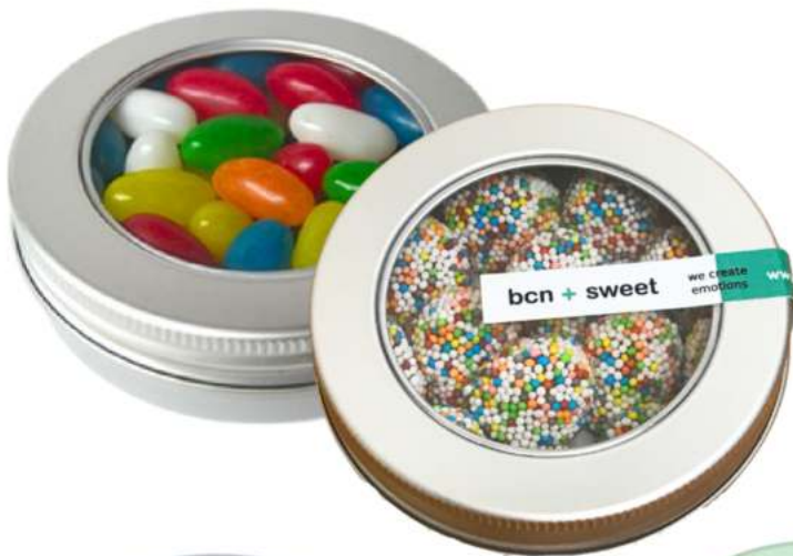
Lata aluminio 100 ml golosinas REF. TIN100