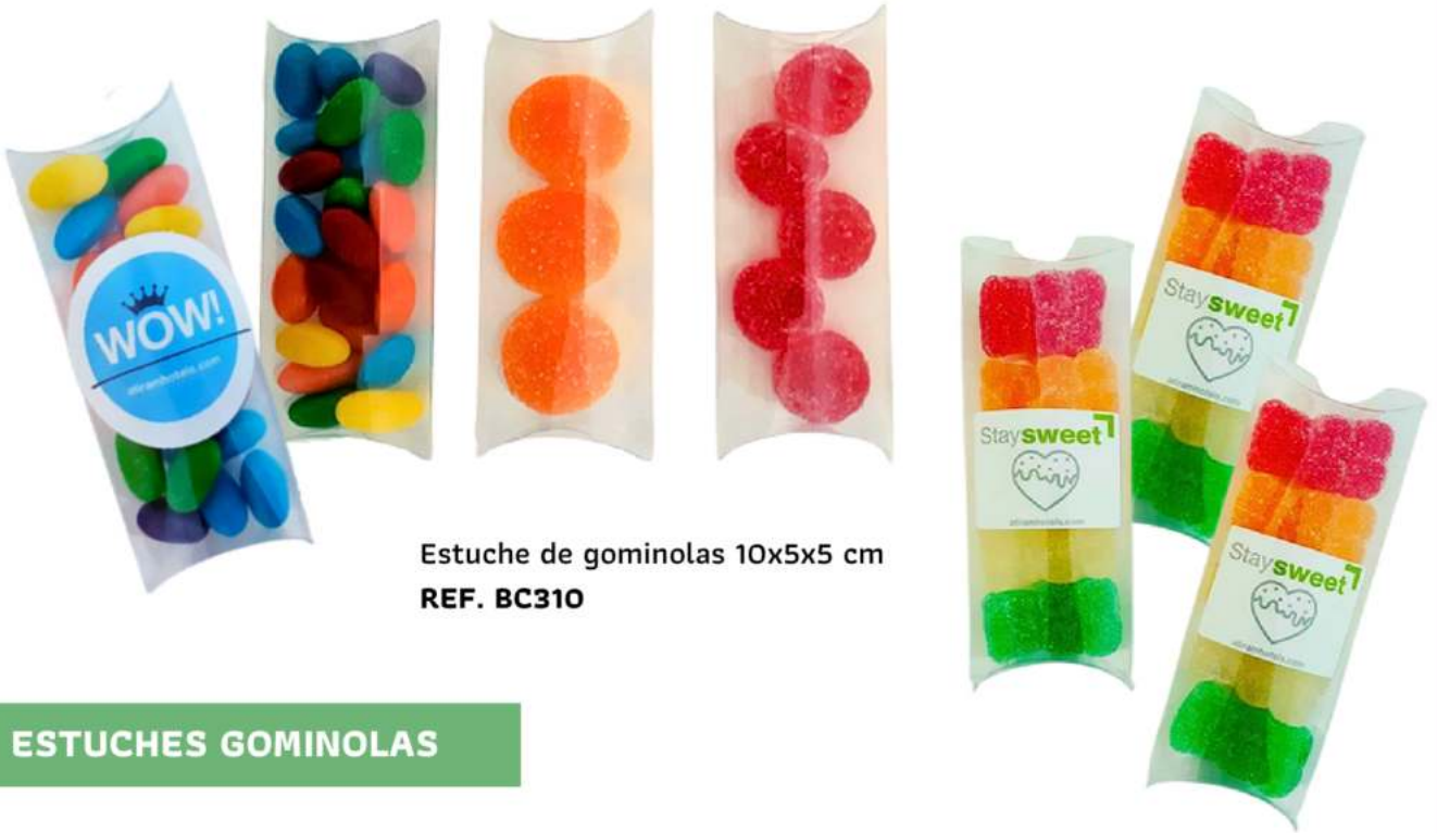
Estuche de gominolas 10x5x5 cm REF. BC310