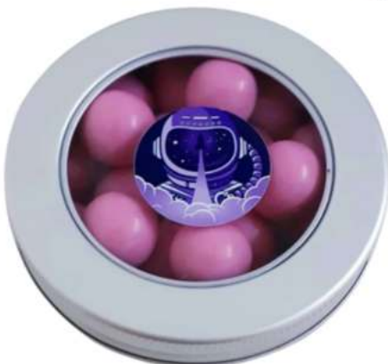
Lata 100 ml chocolate REF. TINH100