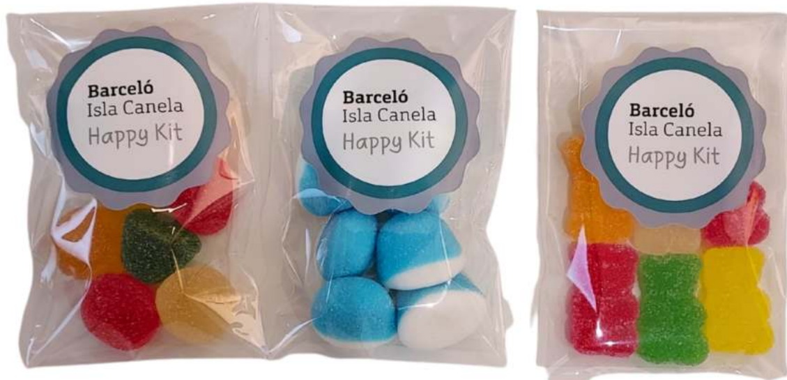
Bolsas 8x12 cm con 6 gominolas REF. BC4