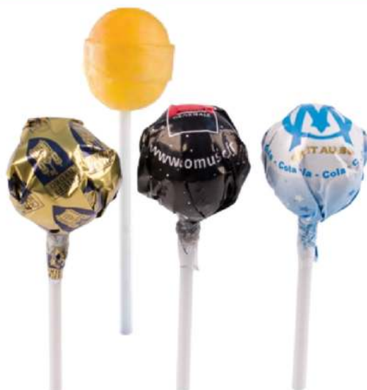
CARAMELO CON PALO REDONDO GRANDE Pedido mínimo: 4.000 unidades