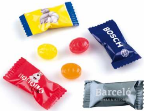
CARAMELO FLOW PACK MINI 445 uds/kg