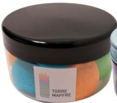
Tarro de gominolas 300ml REF. TC300