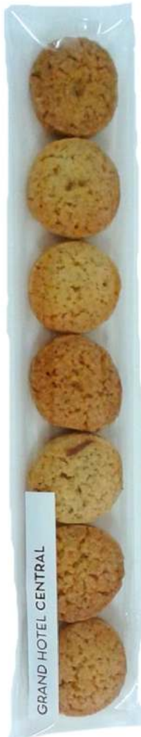
Bolsas de galletas 22x4cm REF. BG2*