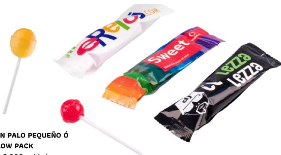
CARAMELO CON PALO PEQUEÑO Ó GRANDE EN FLOW PACK Pedido mínimo: 5.000 unidades