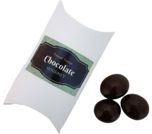
Estuche cartón chocolate REF. ECH3