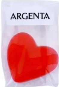
Bolsas 4x6 cm REF. BCO