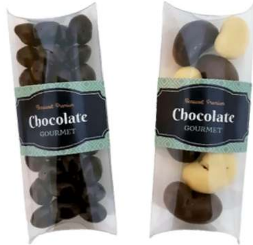
Estuche de cacahuets con choco 10x5x5 cm REF. BCH3102