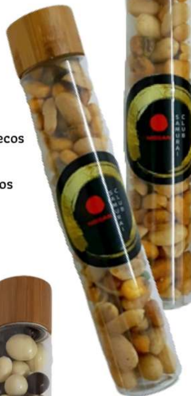
Tubo 90 ml bambú frutos secos REF. TBS90B