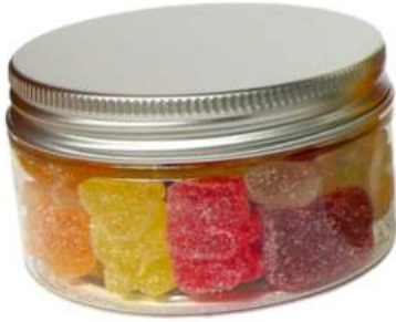
Tarro de gominolas 100ml REF. TC100