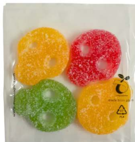
Bolsas Biodegradables y Compostables REF. BEC03

*Pedir presupuesto según medidas de bolsa y relleno