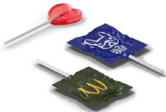
PIRULETA MEDIANA Redonda o corazón 125 uds/bolsa