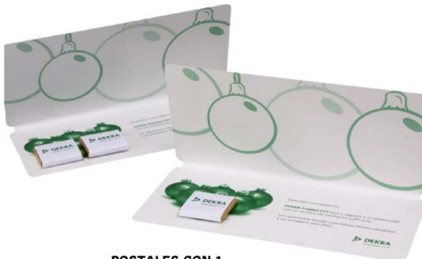
POSTALES CON 1 O 2 NAPOLITANAS 200x90 mm