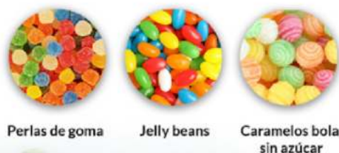
Perlas de goma