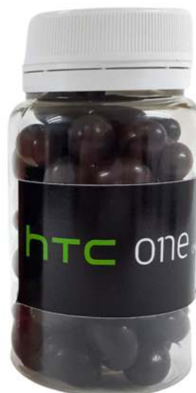
Bote de chocolate 150ml REF. BCH150