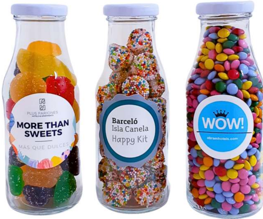
Botella de vidrio gominolas o choco REF. BCV300* || BCVH300*