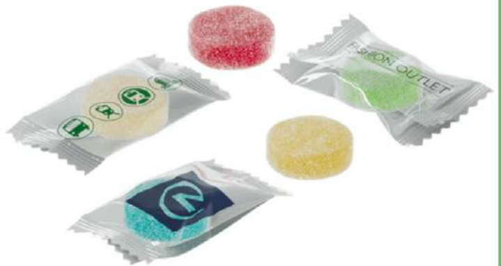
CARAMELO PECTINA FLOW PACK 250 uds/bolsa