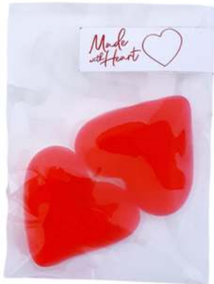
Bolsas 6X8 cm REF. BC1