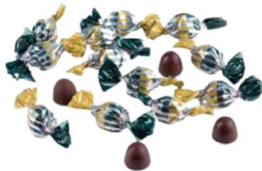
MINI BOMBÓN 2 LAZOS