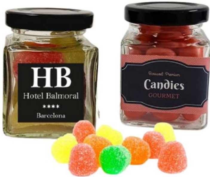
Tarro de gominolas 106ml REF. TCV106