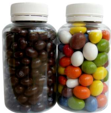
Bote de chocolate 200ml REF. BCH200