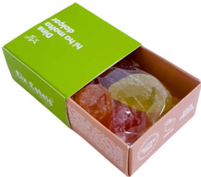
Caja gominolas impresión personalizada 6x6x3 cm REF. CP66

*Consultar disponibilidad de otras medidas