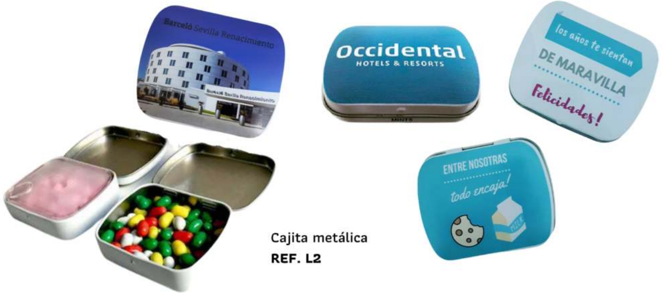
Cajita metálica REF. L2