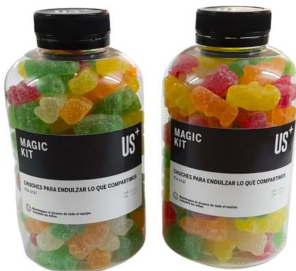
Bote 500ml gominolas REF. BC500