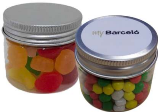
Tarro de gominolas 50ml REF. TC50