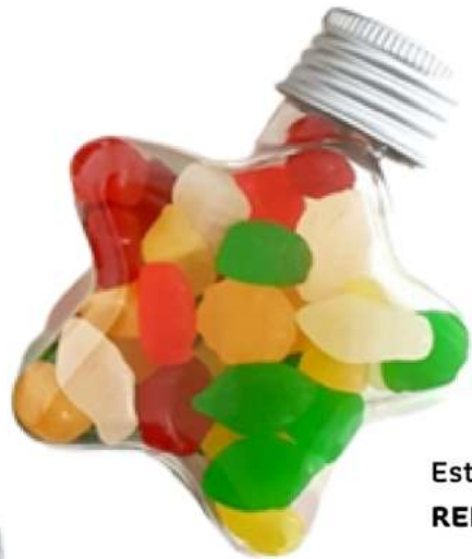
Estrella 80 ml golosinas REF. STC80