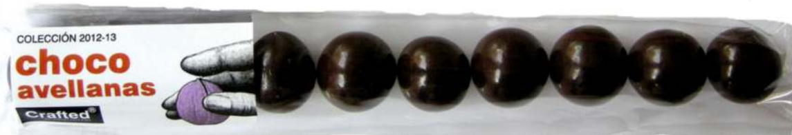
Bolsas de chocolate 22x4 cm REF. BCH2