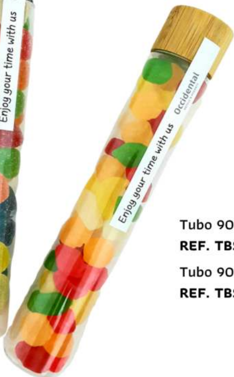
Tubo 90 ml bambú gominolas REF. TBC90B