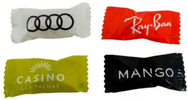
CARAMELO FLOW PACK 300 uds/kg