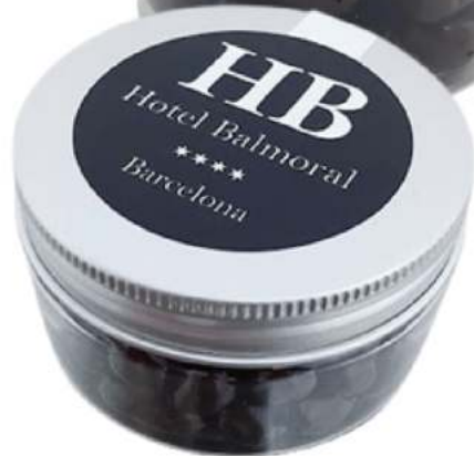
Tarro de chocolate 100ml REF. TCH100