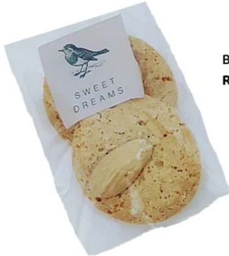
Bolsas de galletas 6x8cm REF. BG1*