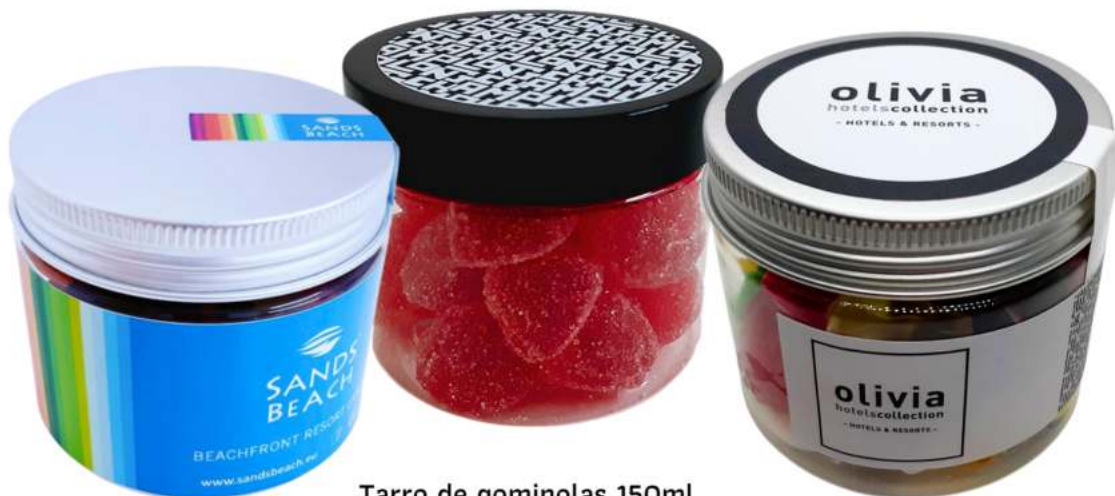
Tarro de gominolas 150ml REF. TC150