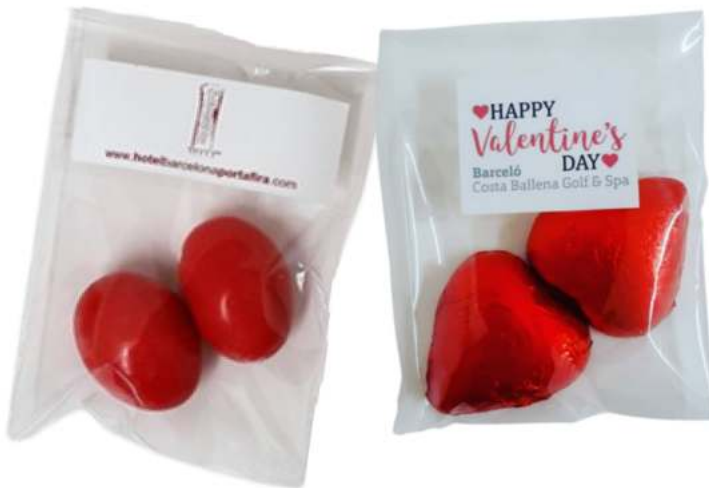
Bolsas de chocolate 6x8 cm REF. BCH1