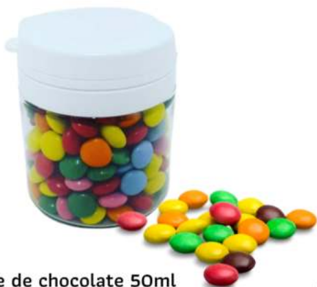
Bote de chocolate 50ml REF. BCH50