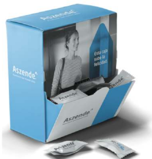
ESTUCHE PESEBRE 130 x 70 x 145 mm