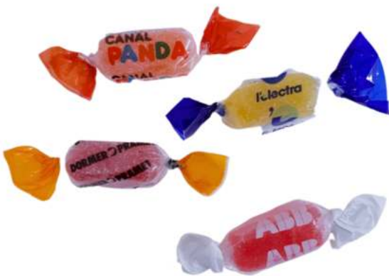
CARAMELO PECTINA 2 LAZOS 180 uds/bolsa