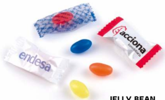
JELLY BEAN 635 uds/bolsa