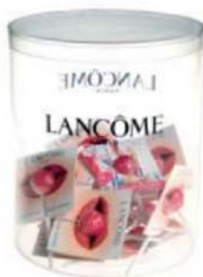
TARROS 170 ø x 200 mm. Acetato 170 ø x 200-160 mm. Plástico estándar