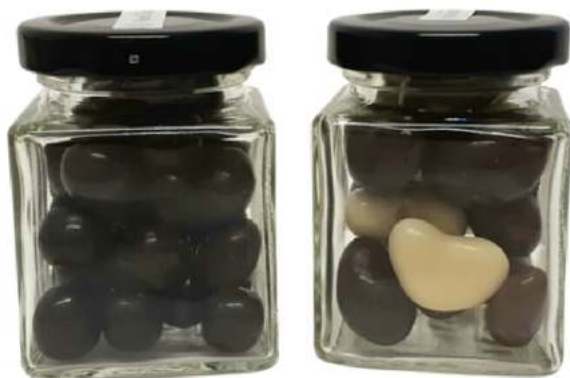
Tarro con chocolate 106ml REF. TCHV106