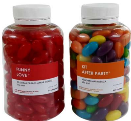
Bote 300ml gominolas REF. BC300