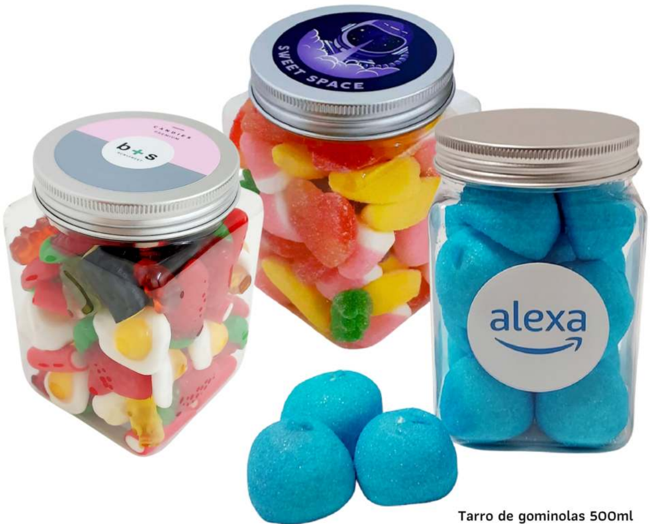
Tarro de gominolas 500ml REF. TCQ500