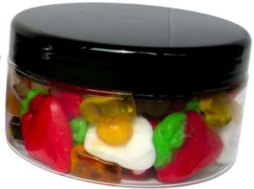
Tarro de gominolas 300ml REF. TC300