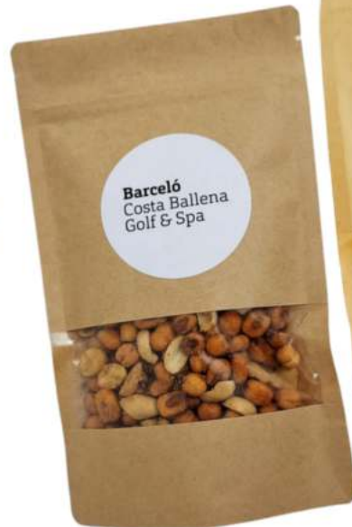
Bolsas kraft frutos secos REF. BKFS9/BKS12