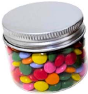
Tarro de chocolate 50ml REF. TCH50