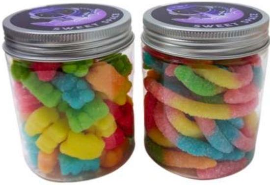
Tarro de gominolas 250ml alto REF. TC250A