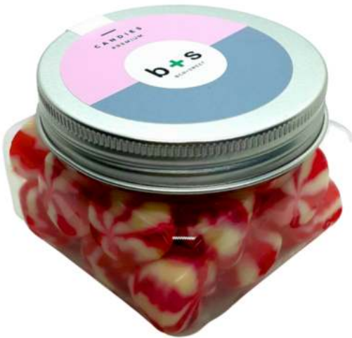
Tarro de gominolas 200ml REF. TCQ200