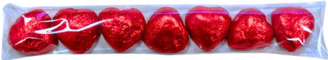
Bolsa 22x4 cm 7 corazones chocolate. REF. BCH2