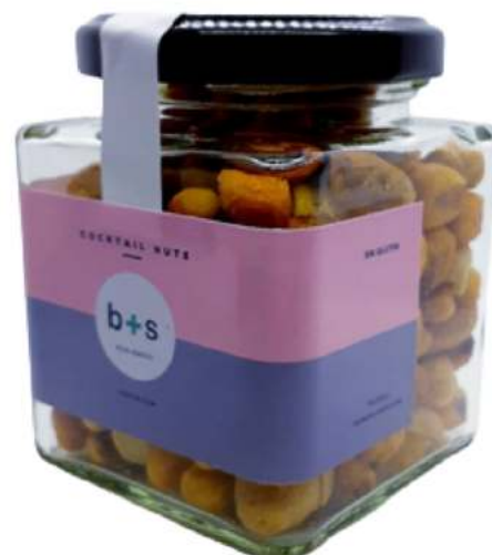
Tarro de frutos secos vidrio 212ml REF. TCVS212