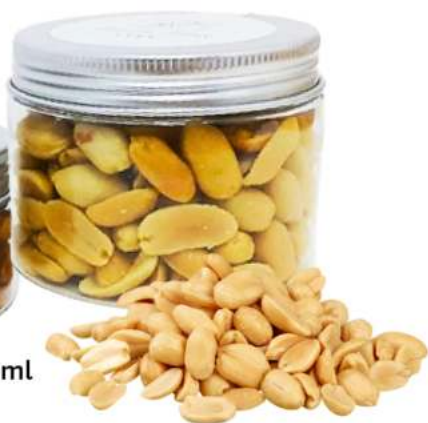
Tarro frutos secos 150ml REF. TCS150