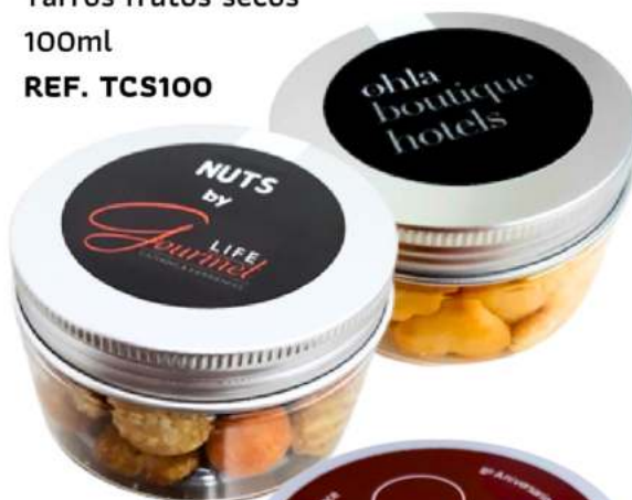
Tarros frutos secos 100ml REF. TCS100